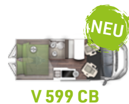
V 599 CB