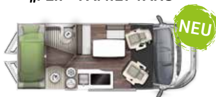
V 599 VB "FLIP"