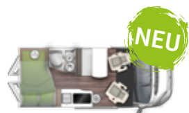
V 541 HBL