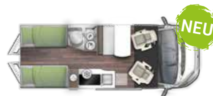
V 636 EB "FLIP"