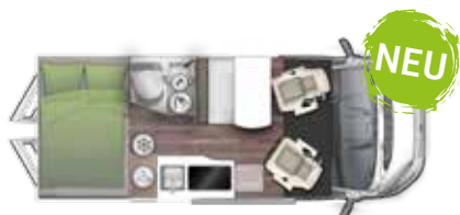
V 599 HB "FLIP"